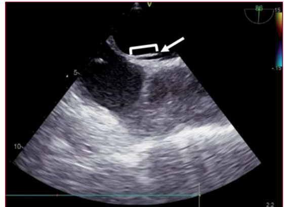
Figura 2. Ecocardiograma transesofágico en enfoque bicava a 86°, que evidencia la presencia de un left sided septal pouch (flecha). Se señala cómo se realizó la medida de la profundidad del mismo.

En relación con la posible asociación entre SP y ACV, nuestro estudio evidenció una tendencia a mayor número de SP en sujetos con antecedentes de ACV respecto a los pacientes sin antecedentes,