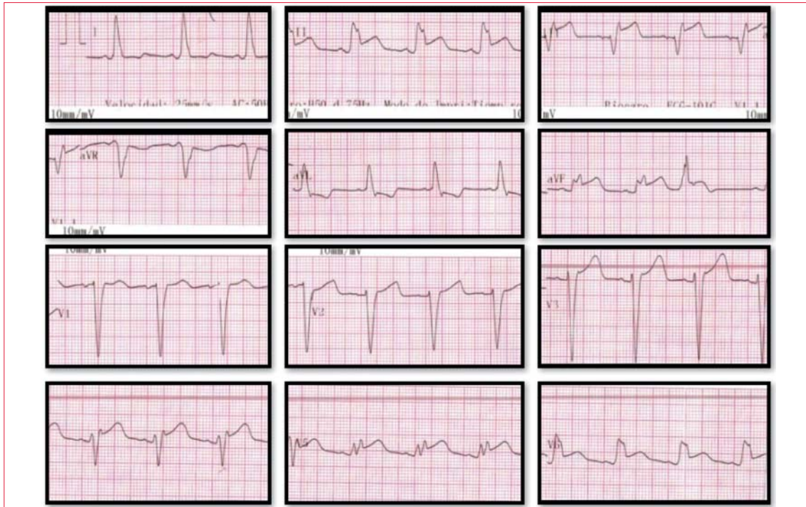
Figura 2. Electrocardiograma al ingreso: ritmo sinusal, FC 78, QRS +60, PR 120 mseg, QRS 120 mseg, BCRI, supradesnivel del segmento ST 4 mm en pared inferior (DII, DIII, AVF) y V4-V6 con imagen especular en pared lateral DI, AVL con infradesnivel del segmento ST horizontal de 2 mm. Signo de Sgarbossa positivo.

quémica, que cursó un síndrome coronario agudo (SCA) sin elevación del segmento ST en agosto de 2018. Se realizó angioplastia con implante de stent metálico sobre ramo marginal de arteria coronaria circunfleja (CX) sin complicaciones, presentando lesión residual moderada (50%) en arteria coronaria derecha (CD) dominante, en su sector distal (figura 1).